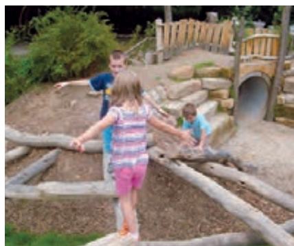
Im „Käferland“ Kamenz fügt sich ein Klettermikado stimmig in das umliegende Gelände ein und dient als verbindendes Element zu einer Hügellandschaft.