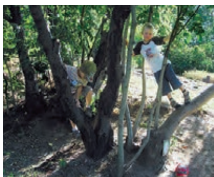
In der Kita „Koboldland“ Dresden-Klotzsche finden die Kinder unterschiedliche Bäume, auf die sie klettern können.

Dieses Prinzip der Vielfalt kann auf dem Gelände an vielen verschiedenen Stellen baulich aufgegriffen werden: Der Aufstieg zum Rutschenhügel kann verschiedenen Wegen folgen, die unterschiedliche Herausforderungen bieten; Hänge und Hügel werden so gestaltet, dass Kinder auf vielerlei Arten den Weg nach oben finden. Auch ein Baumstammkado kann dieses Prinzip aufgreifen, sofern es einige Kriterien erfüllt: Unbedingt ist darauf zu achten, dass es nicht als separates Spielelement geplant wird, sondern mit anderen Gestaltungselementen verbunden wird, indem es beispielsweise im Hang den Weg hinauf zu einem weiteren Erlebnisort bildet. Die Frage nach Spielgeräten ist also immer mit der Frage danach zu beantworten, inwieweit sie die grundlegenden Bewegungsformen (klettern, schaukeln, springen, drehen, balancieren und rutschen) differenziert und komplex aufgreifen können. Rutsche und Schaukel gehören demnach unbedingt in ein naturnah gestaltetes Außengelände!