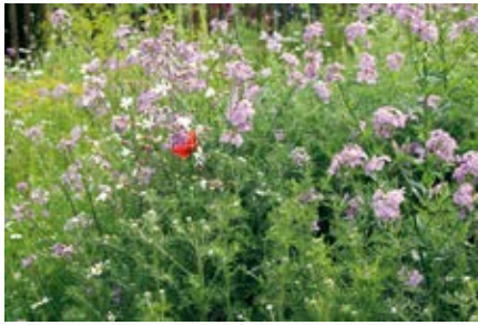
Verwendung heimischer (Wild-)Pflanzen