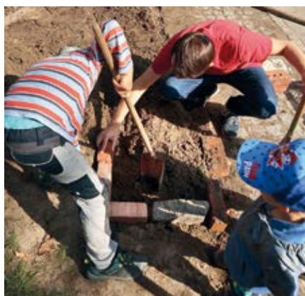
Arbeitseinsätze mit Kindern und Eltern