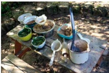
Alltagsmaterialien zum Spielen