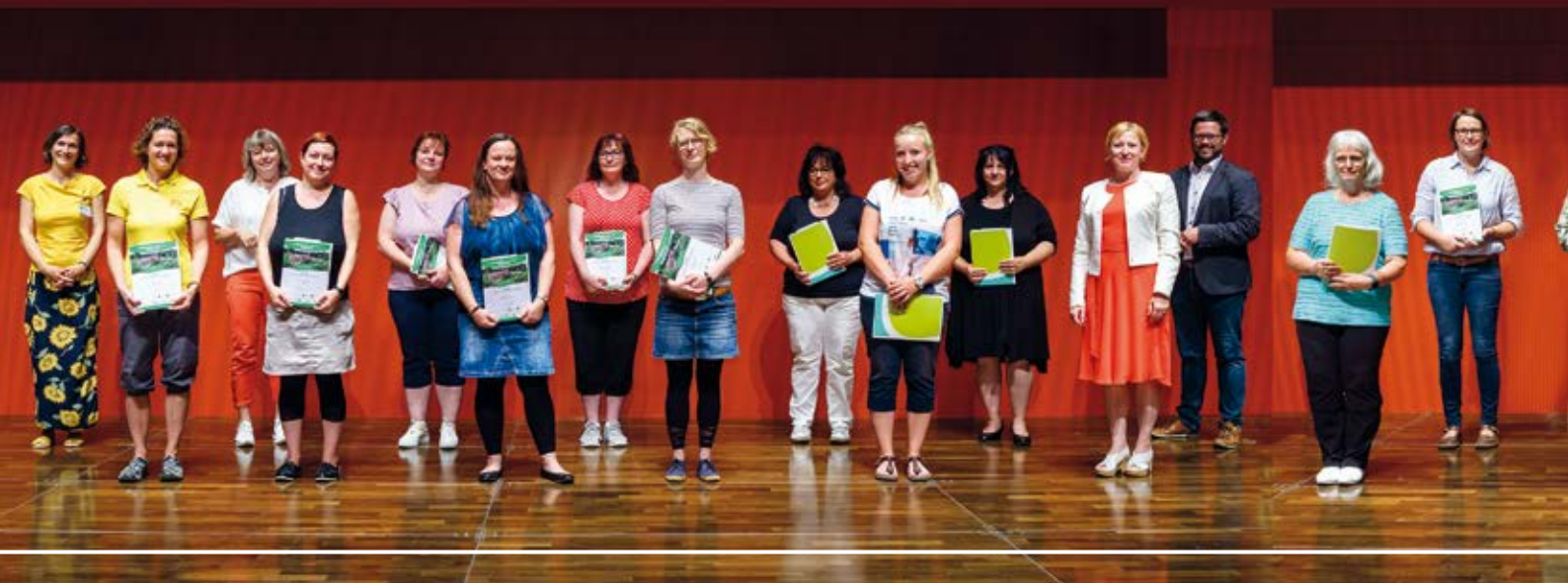
1. Prämierung am 14. Juli 2021

Gleichzeitig greift das Motto auch die Altersübergänge in pädagogischen Teams auf: Demografische Entwicklungen bringen Generationswechsel mit sich. Langjährige Kolleg*innen haben einen Schatz an Wissen und Kompetenzen, der die Arbeit des Teams auch zukünftig bereichern kann, wenn er frühzeitig an jüngere Kolleg*innen weitergegeben und von mehreren Teammitgliedern weitergetragen wird. Bewährte Erfahrungen in der Gartenplanung und -gestaltung können somit weiterwachsen und durch Anregungen neuer Teammitglieder ergänzt werden. Gelingende Übergänge können auch durch gute Zusammenarbeit zwischen Teams verschiedener Kitas, Horte und Grundschulen in der Planung und Gestaltung von gemeinsam genutzten Außenräumen entstehen. Und schließlich können Übergänge auch durch die Verbindung der Innen- und Außenräume unterstützt werden. Bauliche Voraussetzungen können hier pädagogisches Handeln unterstützen und zu einer gelingenden Verbindung von draußen und drinnen beitragen.