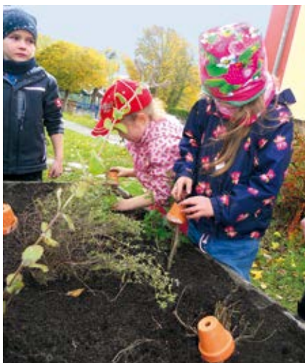
Kinder helfen mit