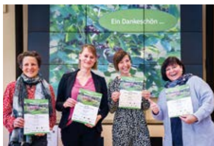
3. Prämierung am 13. Oktober 2022

Während der 2. Stufe bauten die 30 Einrichtungen ihre Vorhaben weiter aus. Informationen zu umgesetzten Projekten und weiteren Plänen reichten die Kitas in Form einer Dokumentation bei der SLfG ein. Am Ende der 2. Stufe wählte die Fachjury zehn Einrichtungen (siehe Kapitel 2.2) für die 3. Stufe aus. Die offizielle Prämierung mit Vorstellung der einzelnen Gartenprojekte fand am 6. April im Online-Format statt. Die Zustellung der Urkunden und Gutscheine für die Preisgelder in Höhe von je 1.000 Euro erfolgte über den Postweg. Im Rahmen des Begleitprogramms des Wettbewerbs fand im Herbst die 1. Online-Fortbildungsreihe statt (siehe Kapitel 1.3). Eine weitere Möglichkeit, Erfahrungen auszutauschen, gab es für die Preisträger am 24. November im Rahmen des kollegialen Austauschs im Online-Format.