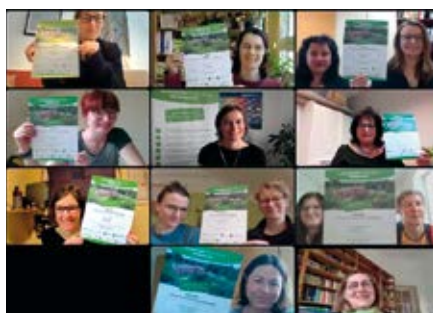
2. Prämierung im Online-Format am 6. April 2022

Im Januar startete der 7. Kinder-Garten-Wettbewerb. Bis zum 31. Mai konnten alle sächsischen Kitas und Kindertagespflegestellen ihre Bewerbungen bei der SLfG einreichen. Im Mai fanden im Rahmen des Begleitprogramms Exkursionen zu ehemaligen Landessiegern des Wettbewerbs und weiteren naturnah gestalteten Kitas statt (siehe Kapitel 1.3). Anhand von pädagogischen und landschaftsgestalterischen Kriterien wählte die Fachjury aus allen 59 Bewerbern die 30 Einrichtungen für die 2. Stufe (siehe Kapitel 2.1) aus. Am 14. Juli wurden diese Einrichtungen offiziell ausgezeichnet. Der Sächsische Staatsminister für Kultus, Christian Piwarz, wandte sich als Schirmherr des Wettbewerbs mit einem Grußwort per Videobotschaft an die Teilnehmenden. Die Referatsleiterin für Kindertagesbetreuung Dr. Nicole Wolfram übergab die Urkunden und Gutscheine über das Preisgeld in Höhe von je 400 Euro. Im anschließenden kollegialen Dialog konnten sich die Preisträger zu ihren Gartenprojekten austauschen.