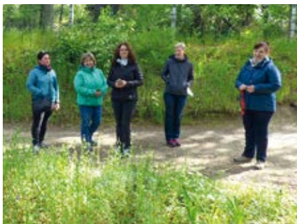
Exkursion 2021, Kita Ebersbach

Im Rahmen des Begleitprogramms zum Wettbewerb fand vom 22. September bis 9. November 2021 die erste Online-Fortbildungsreihe „Unser Kinder-Garten – Übergänge gemeinsam gestalten“ mit 221 Personen statt. In 12 Workshops beschäftigten sich die Teilnehmenden mit den Fragen wie z. B.: Wie können wir Übergänge bei Kindern achtsam begleiten? Und wie lassen sich Übergänge in einem naturnahen Kita-Außengelände ganz praktisch gestalten? Warum tragen Naturerfahrungen zu einer gesunden Entwicklung und Chancengleichheit von Kindern bei? Sind naturnahe Spielanlagen auch sicher? Welche Finanzierungsquellen und gute Praxisbeispiele gibt es? Wie können Hausmeister gut in den Prozess der Pflege und Wartung eingebunden werden?