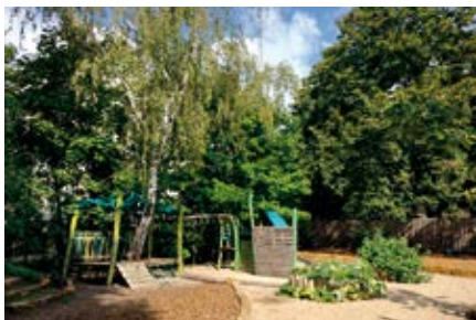
Geringe Versiegelung des Geländes