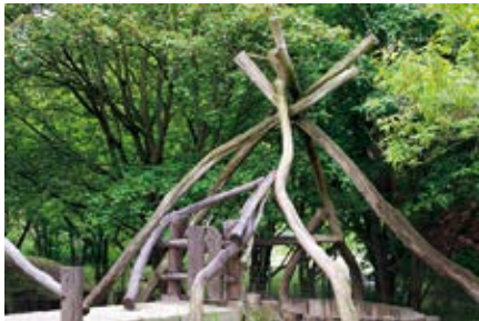
Verwendung von natürlichen Materialien beim Bau