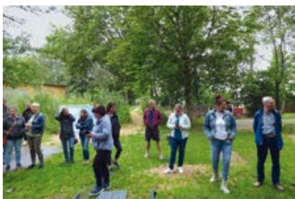
Exkursion 2022, Kita „Kastanie“ Oelsnitz

Im Rahmen der Exkursionen 2021 und 2022 erlebten ca. 200 Teilnehmende die Vielseitigkeit naturnaher Kita-Spiellandschaften direkt vor Ort und konnten sich mit den Verantwortlichen der Einrichtungen zu Ideen, Erfahrungen und Stolpersteinen austauschen und Anregungen für die eigene Praxis mitnehmen.