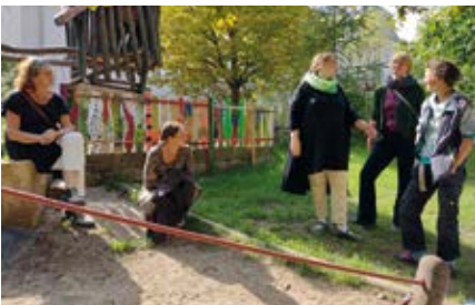
Die Jury vor Ort