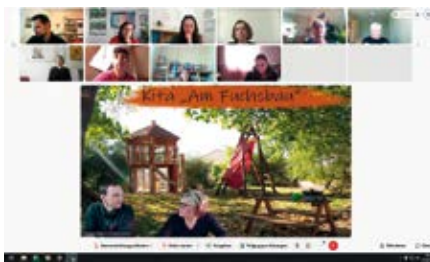
Online-Fortbildungsreihe im Herbst 2022

Auch in der Erzieher*innen-Ausbildung fand das Thema „Bildungsraum Garten“ schon praxisnah einen Platz. Und so besuchten Berufsschulklassen verschiedene Einrichtungen mit beispielhaft gestalteten Außenräumen. Während dieser Fortbildungen vor Ort erlebten die Schüler*innen praxisnah, wie positiv sich die Art und Weise der Umgebungsgestaltung auf die kindliche Entwicklung auswirkt.